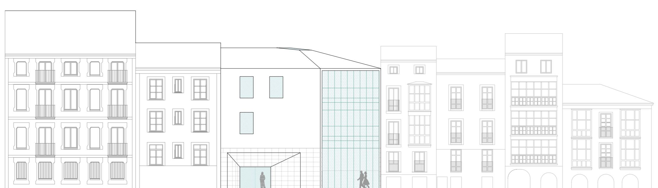
ALZADO C/ FERNAN GONZALEZ E 1:200